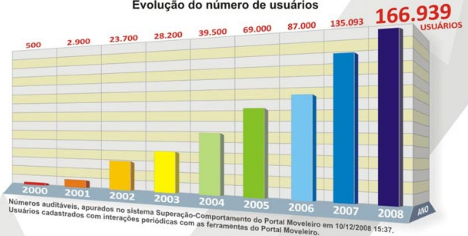
Evolução do número de usuários

Sua empresa pode se beneficiar agora deste público qualificado que não para de crescer.